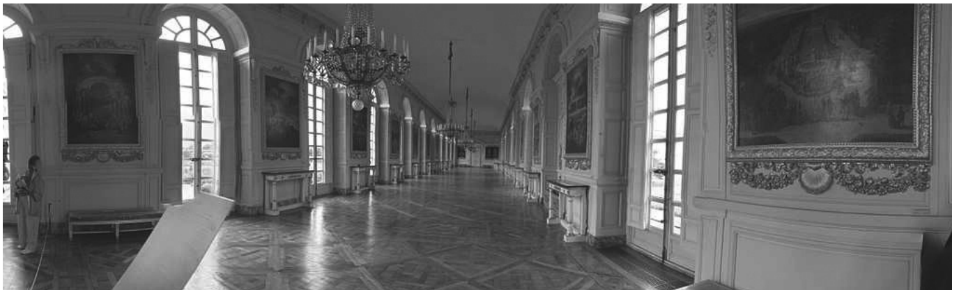
Trianon, Galérie des Cotelles

Az emlékművek témáinak sorában fontos helyen álltak a nemzeti legendárium egyes totemállatai is, és ezek között is legfőképpen a turul-madár, melyről érdemes kicsit bővebben szólnunk. Ez a madár ugyanis (melyet a kerecsensólyommal vagy a vándorsólyommal szokás azonosítani) egészen szép és ártatlan jelentéseket hordoz a magarság eredetmítoszaiban. Az egyik szerint „a magyarok fejedelme még a levédiai tartózkodásuk idején azt álmodta, hogy hatalmas sasok támadták meg az állataikat és kezdték széttépni őket. Az emberek megkísérelték megtámadni a sasokat, de nem sikerült, mert mindig máshol támadtak. Ekkor megjelent egy gyors, bátor turul, és a magasból támadva megölte az egyik sást. Ezt látva a többi sas elmenekült. Ezért elhatározták a magyarok, hogy máshová mennek lakni. Elindul-