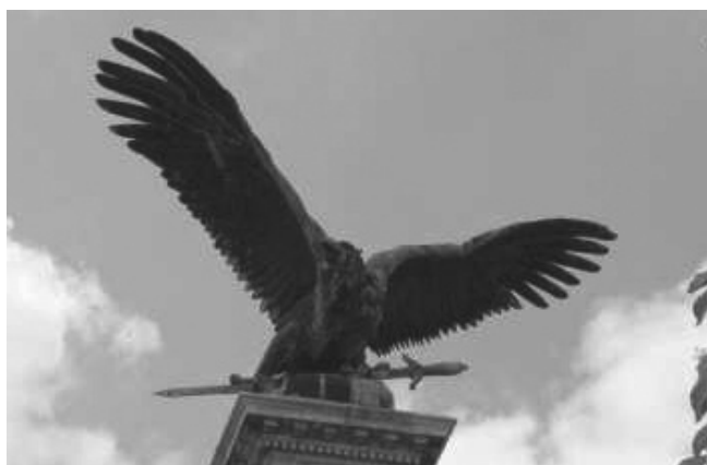
Turul-szobor a Budai Várban

tak Attila földjére, melyet örökül hagyott rájuk, de az utat nem ismerték. Ekkor ismét megjelent a turulmadár, s a fejedelem fölé szállva lekiáltott neki, hogy kövessék őt, míg el nem tűnik a szemük elől. Az álom után nem sokkal dögvész ütött ki az állatok között, s a mindenféle fekvő tetemeken lakmározó keselyűk közül egy arra repülő turul a magasból lerúgta az egyiket. Ezek után felismerve az álmot e jelenetben, az összes magyar felkerekedett és követte a turult. Ahol a madár eltűnt a szemük elől, ott táborot ütöttek, majd ekkor ismét előtűnt a turul, és a magyarok újra követték minden népükkel együtt. Így jutottak el Pannóniába.” 1