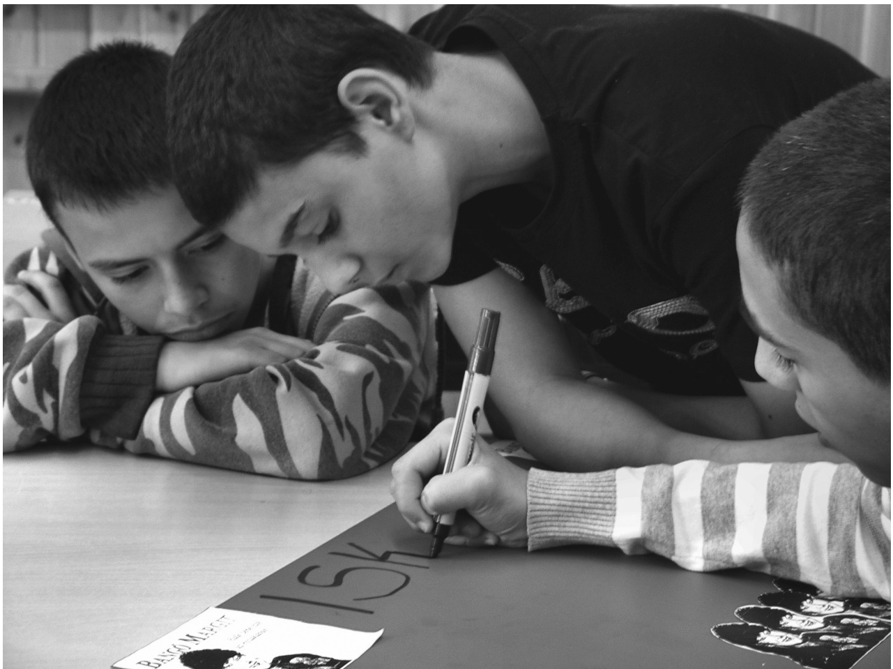
MÁV telepi iskolánk tanulói. Fotó: Koléner Anita

„Az értelmesek pedig fénylenek, mint az égnek fényessége; és a kik sokakat az igazságra visznek, miként a csillagok örökkön örökké.” Dániel 12,3