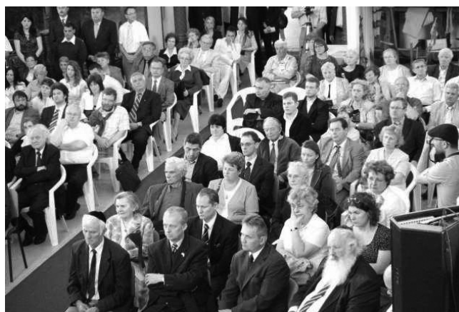
Megemlékezők a zsinagógában