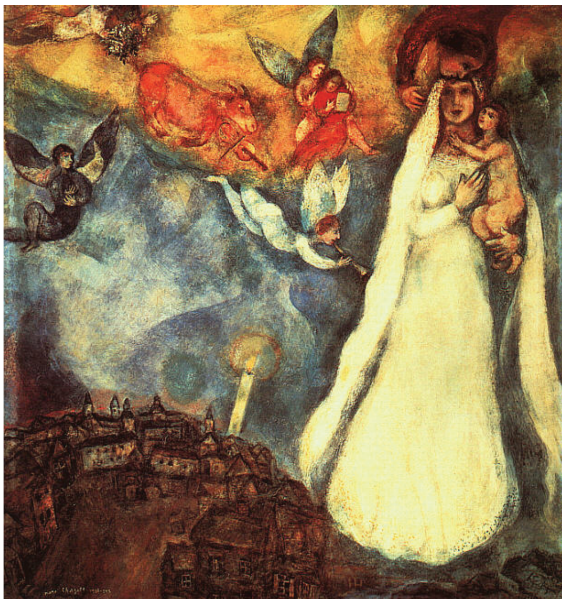
MARC CHAGALL: FALUSI MADONNA