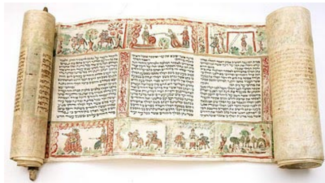
Megilá Eszter - Eszter tekerés

Eszter történetét az ünnepnap előestéjén, majd reggelén felolvassák a zsinagógában. Ezt mindenkinek hallania kell és osztoznia az általános örömben. Az ünnep egyik fénypontja, amikor Hámán nevének felolvasásakor a gyerekek lármázhatnak, lábbal doboghatnak, a padokat üthetik, s a maguk készítette kepreplővel nagy zajt csaphatnak. Régen szokásos volt, hogy a gyerekek két kis kövecskére ráírták Hámán nevét, és addig ütögették egymáshoz, amíg a felirat le nem kopott róluk. Hámán alakját is elkészítették életnagyságban, majd elégették vagy felakasztották. Készítettek Eszter- és Mordecháj-bábokat is tésztából. Az e napra megválasztott „ purim -rabbi” mint jó tréfamester és a Tórában is járatos személy, gondoskodott a szórakoztatásról. Az ünnep együtt járt a „ püremspille ”, a purimi játékkal, ami az Eszter könyvében megírt események commedia dell'arte -szerű előadása.