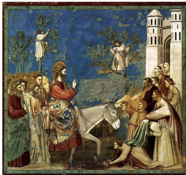
Giotto: Bevonulás Jeruzsálembe

Az előző két tétellel ellentétben a tenor-ária izgatott, szenvedélyes, ugyanakkor időről időre – gyarló, emberi módon – bátortalanul megtorpan, ezzel is érzékeltet-