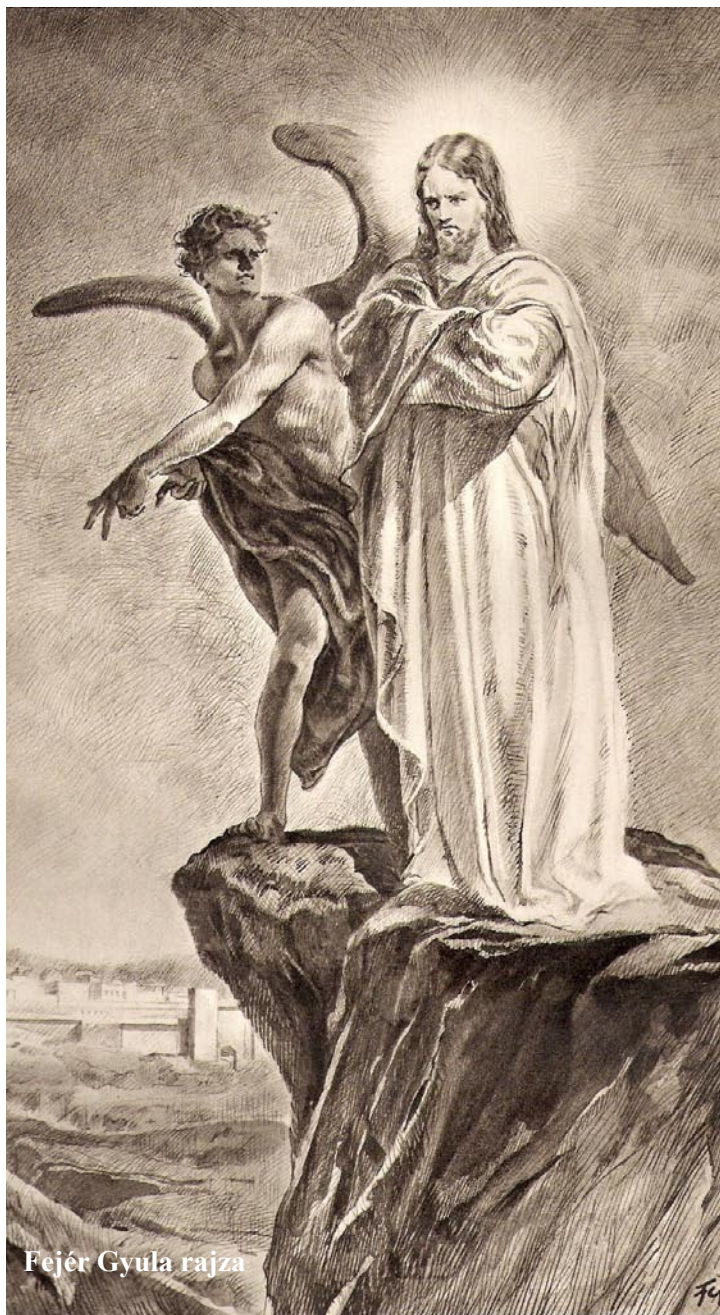
Fejér Gyula rajza