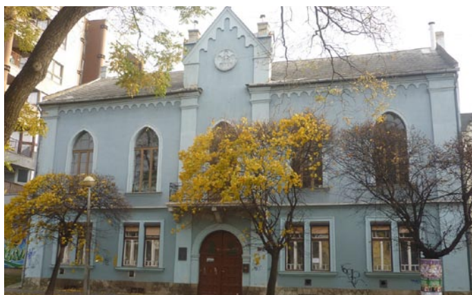
A MET nyíregyházi kápolnája