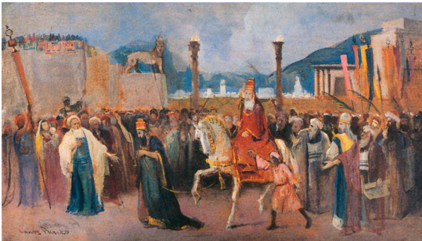
Lakos Alfréd: Mordecháj diadalmenete , 1920-30 körül, olaj, furnér, 42x73 cm, Budapest, Országos Zsidó Múzeum