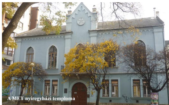
A MET nyíregyházi temploma